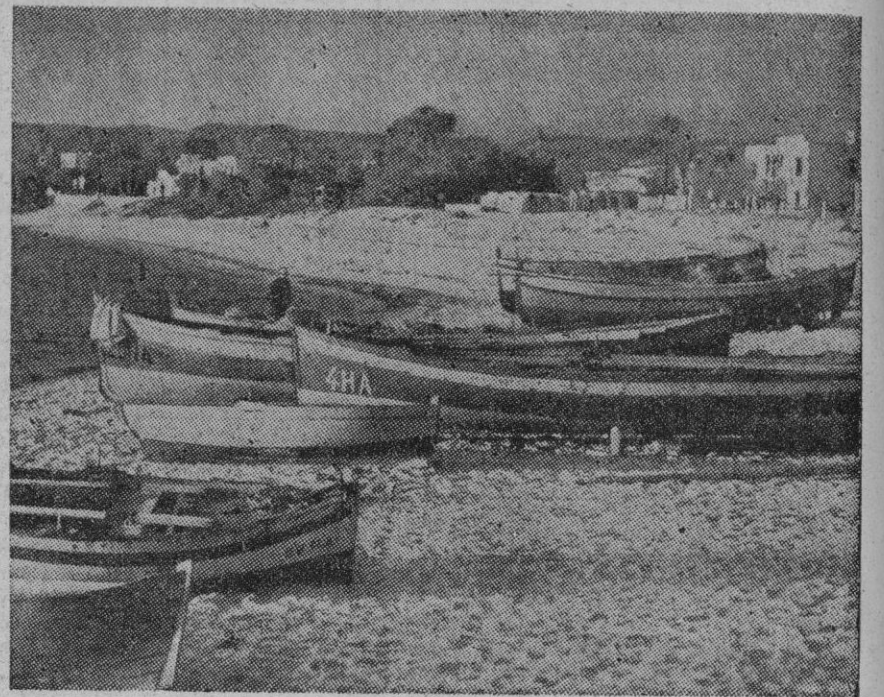
Vista de la placentera y romántica villa de Hammam, en la península del cabo Bon, de Túnez, centro de los combates entre las fuerzas del Eje y aliadas, en la pasada guerra, y que vuelve a estar de actualidad al penetrar en ella fuerzas francesas para realizar operaciones de limpieza.

Tropas francesas y coloniales penetran en la Península de Bonn