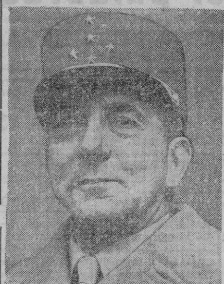
El general De Lattre

Era alto comisario de Francia en Indochina