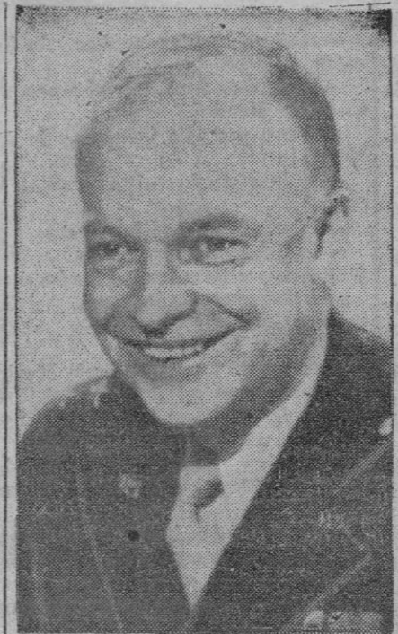
El general Eisenhower