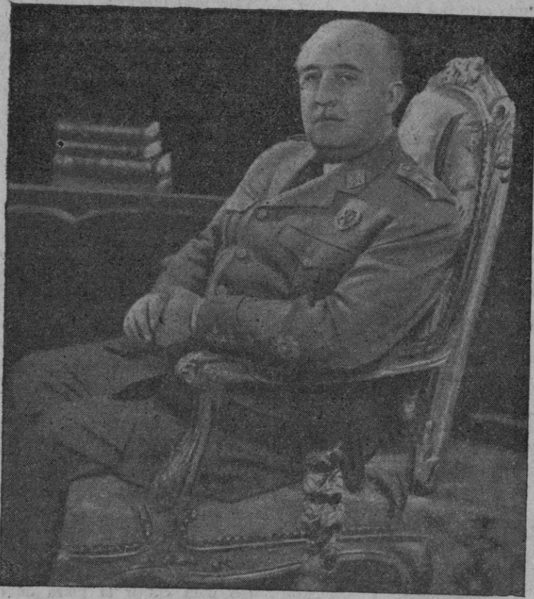
Su Excelencia el Jefe del Estado que ha hecho importantes declaraciones al representante de la revista neoyorquina «Newsweek»

—Los Estados Unidos han considerado... (Continúa en la página 3)