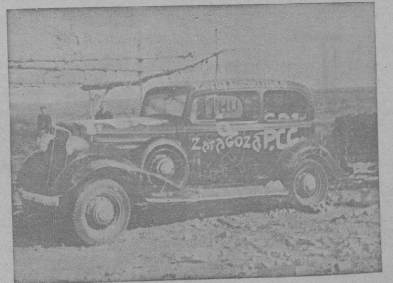
Automóvil que dejaron abandonado