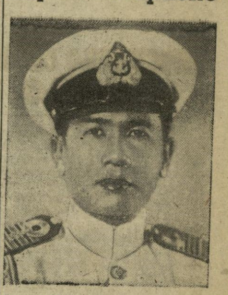
Luang Phibul Songgram, que fué secuestrado por los rebeldes y puesto en libertad al ser derrotados por las fuerzas rebeldes

El jefe del Gobierno Songgram ha vuelto hoy a su despacho