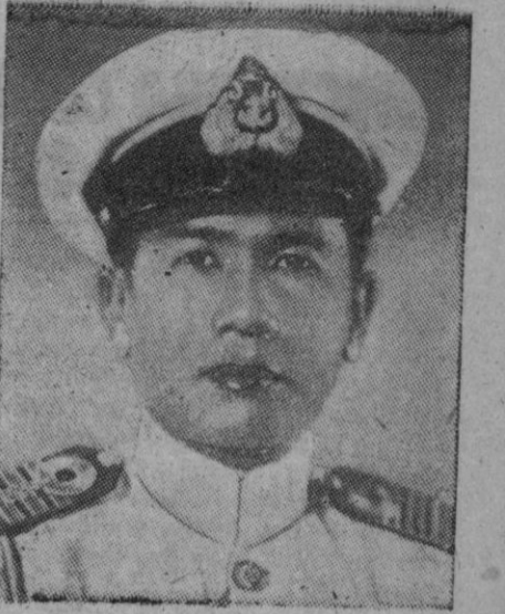
Luang Phibun Songgram, que fué secuestrado por los rebeldes y puesto en libertad al ser derrotados por las fuerzas rebeldes

El jefe del Gobierno Songgram ha vuelto hoy a su despacho