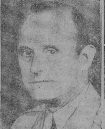
El general de división Alfred M. Gruenther, que ha sido nombrado jefe del Estado Mayor del general Eisenhower, nuevo jefe del Ejército de los países del Pacto Atlántico

30 litros por metro cuadrado en Córdoba Córdoba, 2.—Se ha recrudecido el temporal de lluvias. Durante toda la madrugada, y esta mañana no ha cesado de llover, en forma muy curiosa. Los aguaceros se reanudan este mediodía. Se calcula que se han recogido unos 30 litros de agua por metro cuadrado.—Cifra.