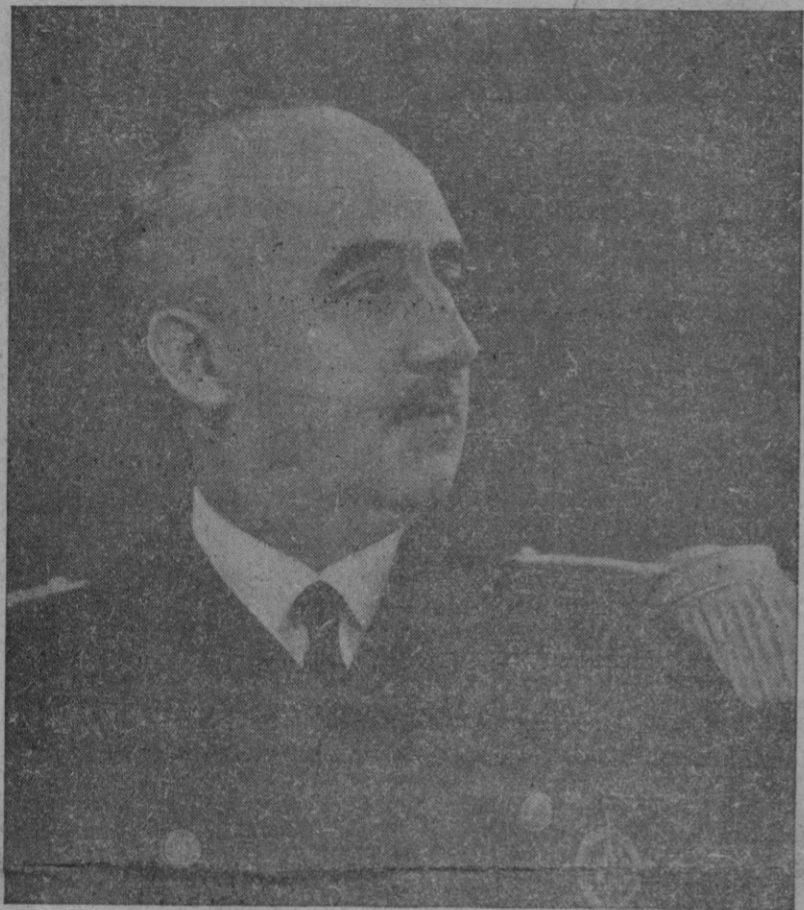
Su Excelencia el Jefe del Estado español, que con motivo de Año Nuevo, ha dirigido un mensaje augural al pueblo español, en el que hace un resumen de la vida nacional en 1950 y pide a Dios nos conduzca por el camino de una paz justa. Con igual fervor formulamos votos por que la Providencia colme de venturas el hogar de nuestro Caudillo, en el año que acaba de comenzar

Si otros países no sirviesen con sus torpezas al enemigo común, la amenaza de guerra hubiese desaparecido. Nosotros hemos ganado la primera batalla que otros empiezan a librar