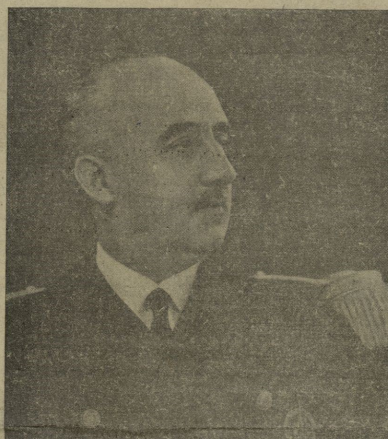
Su Excelencia el Jefe del Estado español, que con motivo de Año Nuevo, ha dirigido un mensaje aural al pueblo español, en el que hace un resumen de la vida nacional en 1950 y pide a Dios nos conduzca por el camino de una paz digna. Con igual fervor formulamos votos por que la Providencia colme de venturas el hogar de nuestro Caudillo, en el año que acaba de comenzar