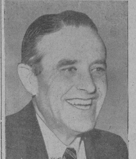
Averell Harriman, que ha sido nombrado consejero particular del Presidente Truman