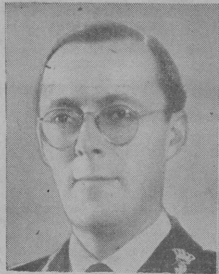
El príncipe Bernhard, de Holanda, esposo de la Reina Juliana, que está efectuando un viaje por América del Sur y el Canadá