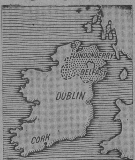
Gráfico de Irlanda. La zona señalada con puntos representa el territorio de Irlanda del Norte que continúa segregada del Eire, cuya independencia acaba de ser proclamada y reconocida

Grandiosa manifestación Dublín, 18 (1 t.).—Para conmemorar la implantación de la República irlandesa, se ha reunido en la calle O'Connor la más grande multitud de 200.000 irlandeses. A las 23.05 horas de Greenwich comenzaron a hacerse disparos de salvas de cañón con motivo de la festividad que se celebra.—Efe.