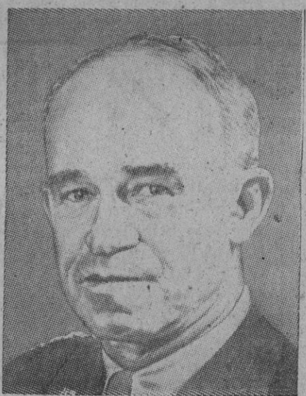
El general Omar N. Bradley

Pacto del Atlántico Norte. Rechazó de plano el argumento de que será imposible, llegado el caso, impedir a Rusia la conquista de Europa, con-