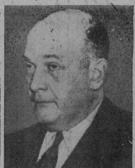
Louis Johnson, secretario de Defensa norteamericano

Washington, 28.—En su toma de posesión de la Secretaría de Defensa, en la que sucede a James Forrestal, Lous Johnson dijo: «deseamos la paz, siempre que podamos lograrla humanamente, con honor y libertad. Pero si se produce una agresión, confiamos en que, nos sea posible ponerle coto. La magnitud de la tarea defensiva no ha sido cosa de nuestra elección, sino que nos la han impuesto las circunstancias mundiales. Los Estados Unidos están obligados a defender no sólo sus intereses naturales, sino también los principios democráticos mundiales.»—Efe.