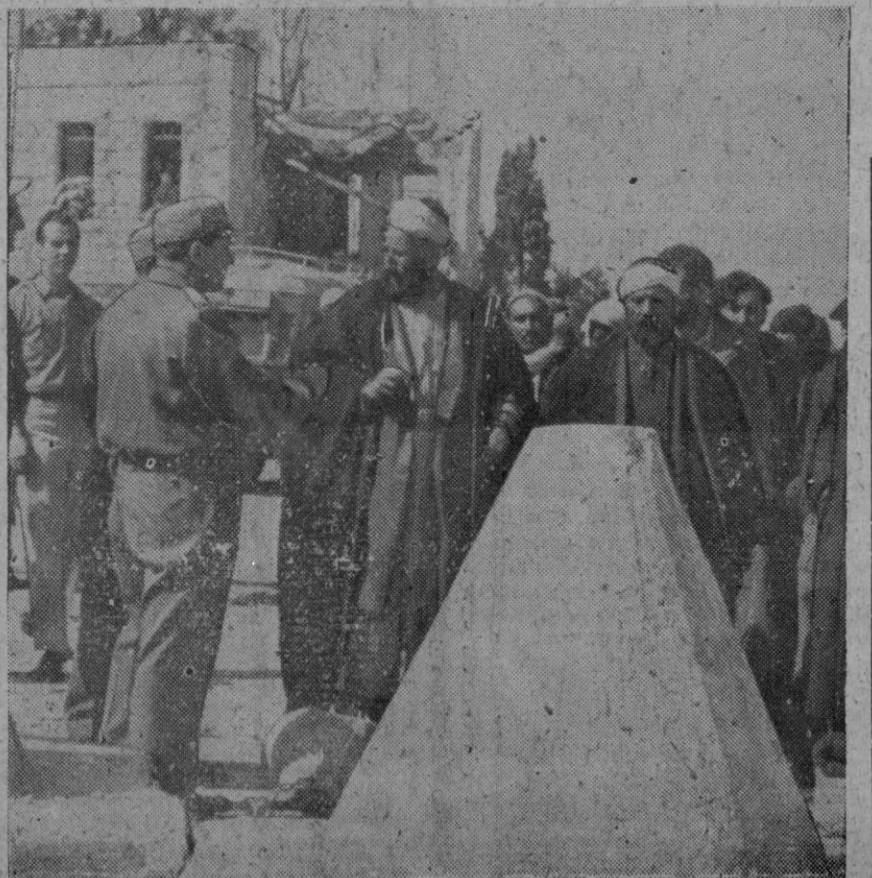
En Palestina se ha verificado el canje de 675 judíos por 4.800 soldados árabes. En primer plano aparecen los negociadores árabes y judíos. Al fondo, un grupo de prisioneros árabes liberados

Manila, 7 (6 t.).—El Senado ha ordenado la detención inmediata de once senadores que boicotean las sesiones en la pugna establecida por la presidencia de la Alta Cámara. El defensor de José Avelino y su bloque han informado al Tribunal Supremo que presentará una moción para que se revise la petición de Avelino. Un grupo de doce senadores respaldados, por el Presidente Quirino y por el del Senado Mario Cuenco, ha respondido adoptando una resolución por la que se ordena la detención de los once senadores citados.—Efe.