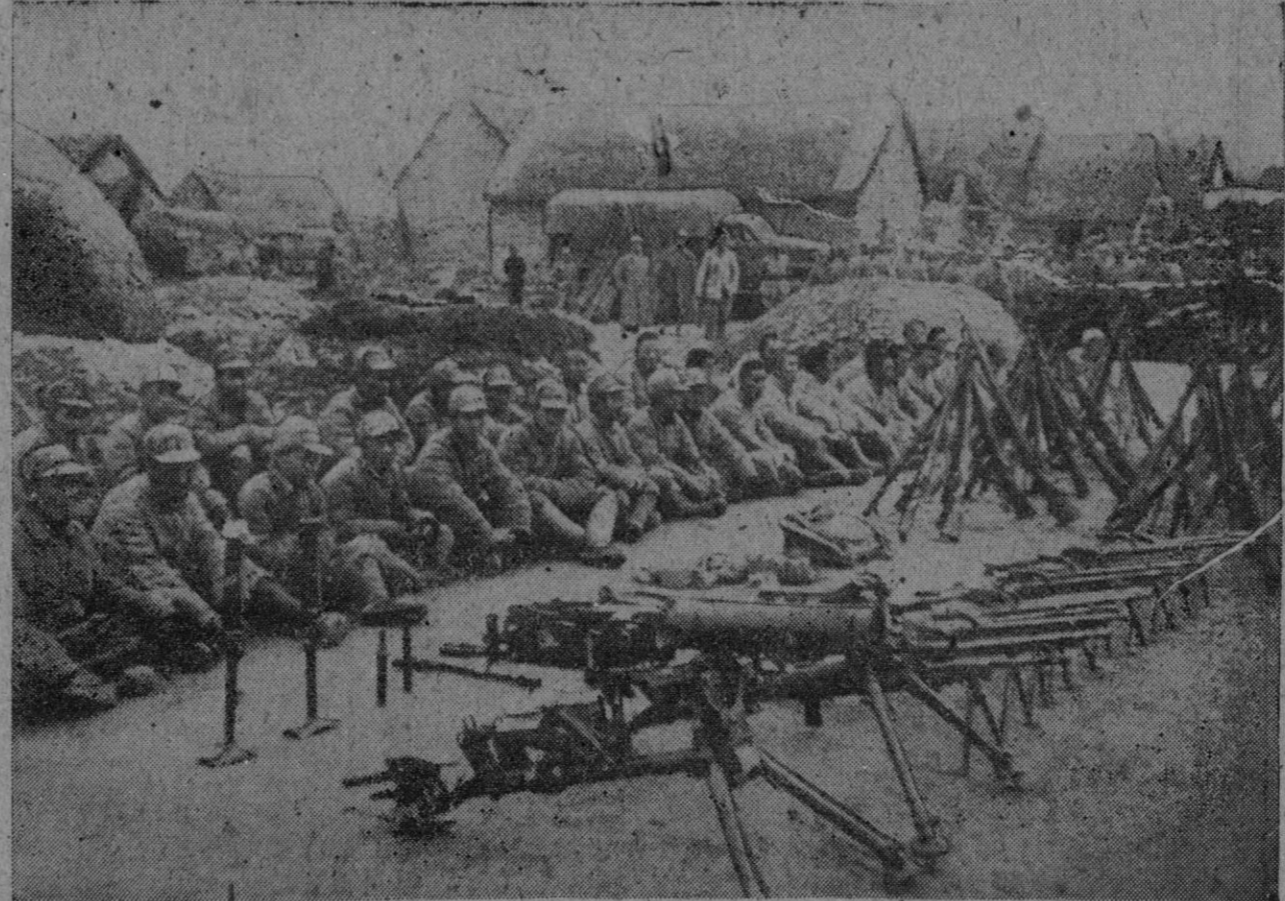
Tropas chinas descansando en la periferia de Suchow después de una agotadora marcha