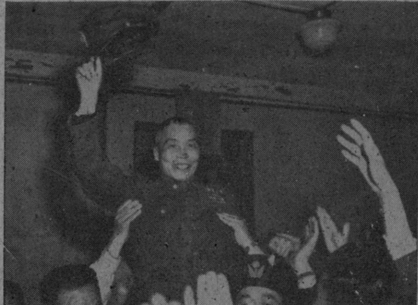
Arriba: El general Li Sung-jen, vicepresidente de China, respondiendo a las aclamaciones del pueblo con motivo de su elección. Abajo: Chang-Kai-Chek y su esposa, en el momento de ir a cumplimentar a Li Sung-jen. A la entrada de la residencia de éste son recibidos por el vicepresidente y su esposa

El acuerdo comercial establece un programa de intercambio normal. Rusia suministrará materias primas y productos esenciales, incluyéndose cereales, minerales, madera y fertilizantes. Italia enviará artículos industriales y agrícolas.—Efe.