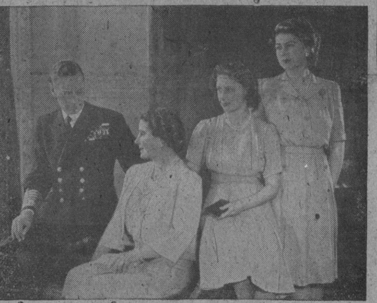
Los reyes Jorge VI e Isabel, con sus hijas las princesas Isabel y Margarita