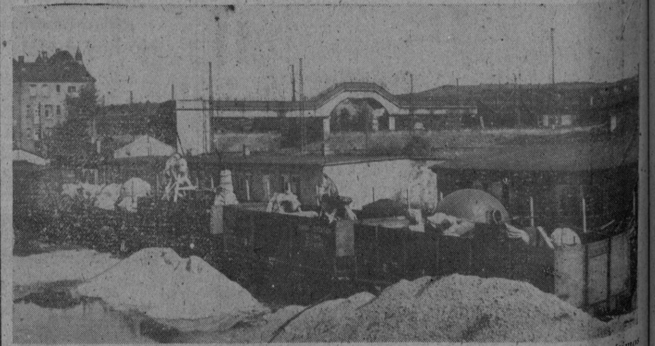
Las autoridades aliadas en las zonas de Oeste de Alemania, todavía están devolviendo a sus legítimos propietarios, las máquinas y equipos de que se apoderaron los alemanes en los países que ocuparon durante la guerra. He aquí un tren americano cargado de esas máquinas ya en marcha hacia la frontera