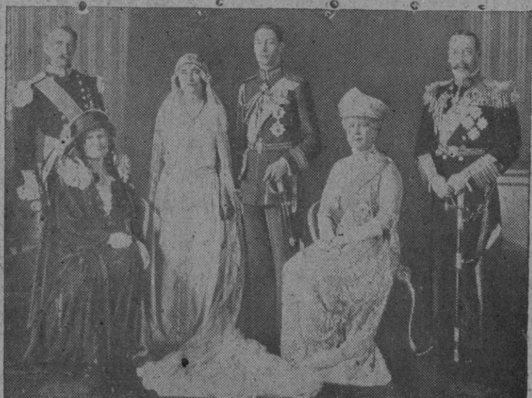
Grupo familiar del rey Jorge VI, la reina María, su hijo, el actual rey Jorge, el día de la boda de éste con lady Elisabeth, Bowes-Lyon, hija de los condes de Strathmore y Kiaghorne, que están a la izquierda

Castellón, 15.—Ha causado general alegría la firma del acuerdo comercial con Suecia para la exportación de ciento cincuenta y cinco mil toneladas de naranjas.—Logos.