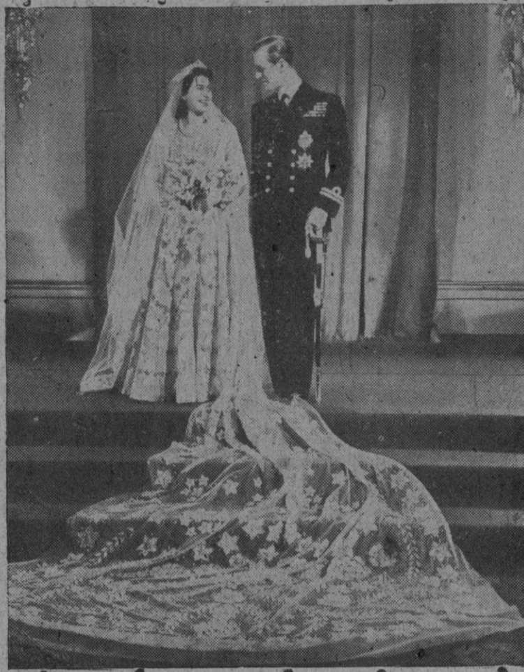
Fotografía de los duques de Edimburgo, ella princesa Isabel de Inglaterra, tomada momentos después de la boda

En un editorial sobre la Monarquía «Sunday Graphic» dice: «El Soberano es más que un símbolo de esta gran unidad de la Commonwealth y el imperio de su alma, el bebé regio dará a todos los pueblos británicos y a todas las demás razas que comparten su lealtad al trono, una nueva seguridad de que la Monarquía permanecerá, de que Gran Bretaña y el Imperio continuarán mostrando al mundo un resplandeciente» (Continúa en la página 4)