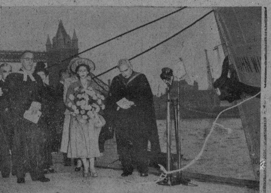
Se ha verificado en Tower Pier (Londres), actuando como madrina la princesa Margarita Rosa, hija menor de los Reyes de Inglaterra, el baptizo de un navío que el próximo otoño establecerá un servicio regular de misión en el Pacífico, transportando niños a la pensión perteneciente a la obra de las misiones de Londres, situada en Beru, y toda clase de viveres y objetos necesarios. He aquí a la princesa en el acto de la bendición