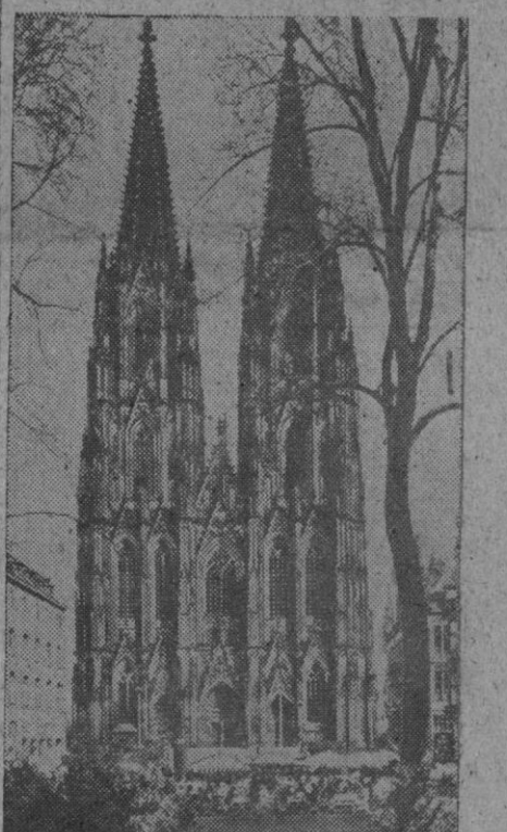
La catedral de Colonia, cuya construcción comenzó en 1248, quedando terminada en 1880.

Medio millón de personas oyeron la misa de pontifical a través de los altavoces