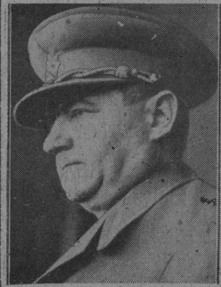
Apenas ha estrenado su uniforme de Presidente comunista de Checoslovaquia y, según se afirma, Gottwald ya ha caído en desgracia de su "padre" Stalin, como un Tito más