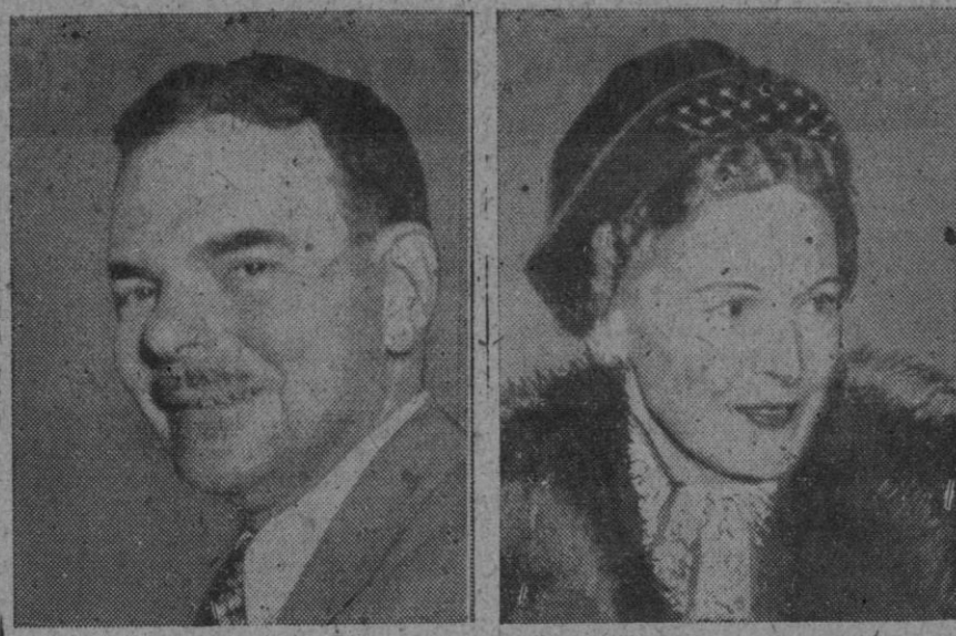
Thomas E. Dewey y su esposa, a quienes se consideran futuros moradores de la Casa Blanca, ya que Mr. Dewey parece contar con muchas probabilidades de triunfo en las próximas elecciones presidenciales