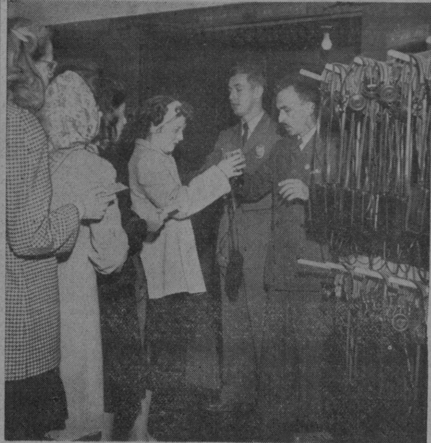
Los visitantes de la Asamblea general de la O. N. U., en Flushing Meadows—Nueva York—han decidido colocar en la entrada a la misma, un ingenioso aparato transportable, que les permitirá seguir el hilo de los discursos que allí se pronuncien, en inglés, francés, chino, ruso y español. En la fotografía puede verse el momento de la instalación del mecanismo de referencia

Serán estudiadas de nuevo las solicitudes de ingreso de seis países