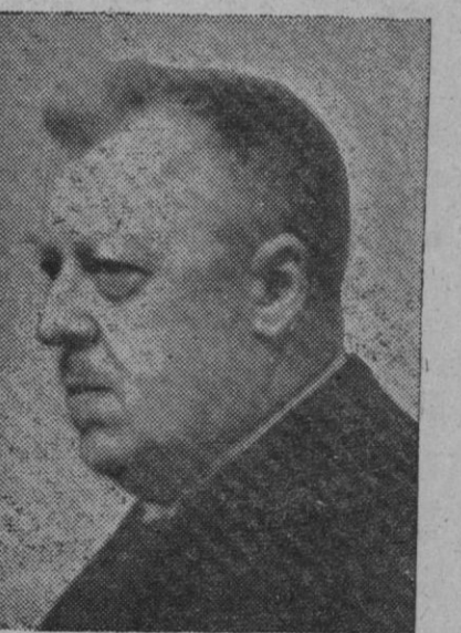
El doctor Eckenner, inventor del zeppelin

Atenas, 30 (7 t.).—En un choque entre tropas del Gobierno griego y guerrilleros, un oficial griego ha resultado muerto y siete soldados gravemente heridos. El hecho ocurrió en un lugar de la carretera que conduce de Salónica a Sedes, aeropuerto utilizado por las fuerzas aéreas gubernamentales.