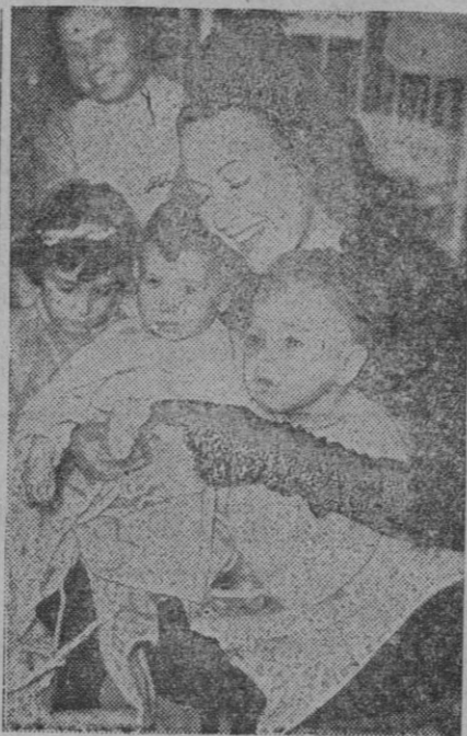
Grace Moore, la famosa artista de la pantalla, aparece aquí fotografiada con los enfermos del hospital Queen Mary, de Londres, después de participar en un concierto a beneficio de dicha institución.

El Príncipe Gustavo Adolfo y su ayudante tomaron el avión en Amsterdam; regresaban a Suecia después de su estancia de varios días en Holanda, invitado el primero por el Príncipe Bernardo, de los Países Bajos. Grace Moore subió a bordo en Copenhague, y se proponía actuar el lunes en un concierto en Estocolmo. De las 22 personas ocupantes del avión y muertas en el accidente, 16 eran pasajeros y seis tripulantes.