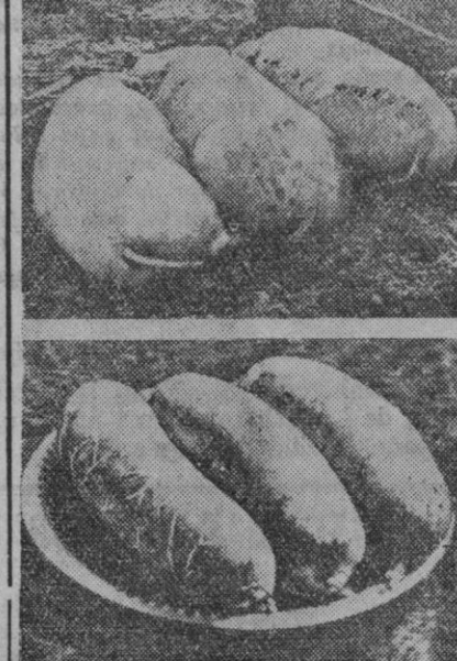
Esta humorística composición fotográfica presenta tres cerditos durmiendo. Más abajo "volvemos a verlos" en forma de embutido, ¡y casi no han cambiado de postura!

Contra lo que mucha gente cree, los cerdos son animales muy sensibles a la suciedad, sintiendo verdadera apatencia por lugares limpios y bien acondicionados, como plenamente está demostrado. Hay, pues, que desechar la vulgar y errónea concepción que tanto ha popularizado sus modales y maneras de vivir en sentido de peyorativa inferioridad higiénica. Difícil sería explicar el motivo que ha dado origen a las falaces y equivocadas denominaciones con que se le suele designar, así como el de pocilgas aplicadas a sus viviendas, mantenidas a través de los siglos desde la más remota antigüedad.