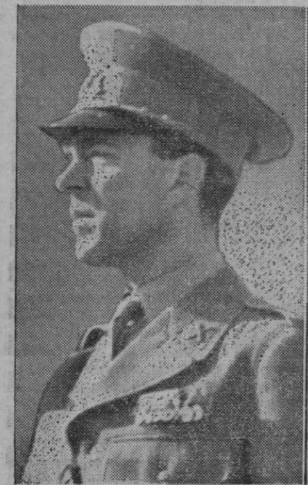
El príncipe Gustavo Adolfo

Washington, 27 (r. t.).—Sumner Welles, ex secretario de Estado norteamericano, ha elogiado las elecciones bolivianas, diciendo que son una muestra del retorno a los procedimientos de la verdadera democracia. En cambio—agregó—, las elecciones en Polonia fueron de toda clase de intimidaciones, fraudes y corrupción de dirigentes y de opositores y de dificultades puestas al paso de la oposición para que no concurriera a las urnas.—Efe.