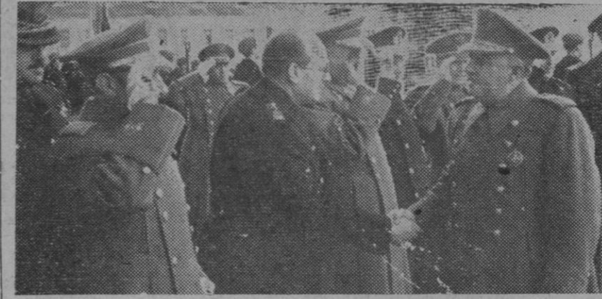
El Jefe del Estado saluda a los miembros del Gobierno, a su llegada al Monasterio de El Escorial