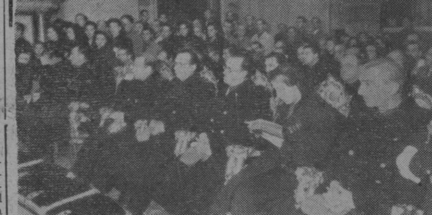
El Gobierno en pleno, frente al presbiterio, ocupó sus sitials durante las exequias