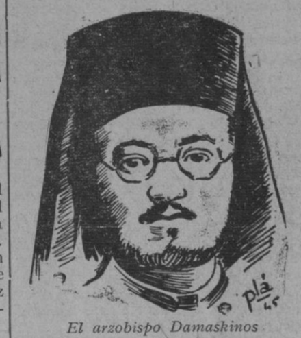
El arzobispo Damaskinos

Atenas, 21.—El arzobispo Damaskinos, Regente de Grecia, ha dimitido. Esto ha sucedido al manifestar el primer ministro saliente, Kanellopoulos, que estaba plenamente autorizado a continuar las negociaciones del Regente y a representar todas sus funciones. Por tanto, el Gabinete de Sufolis prestará su juramento ante el primer ministro saliente.—Efe.