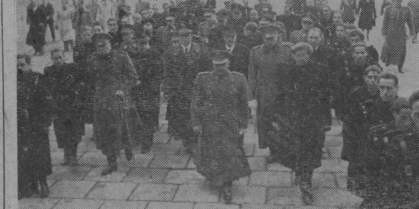
El Jefe del Estado entrando en el Monasterio de El Escorial, seguido por los ministros