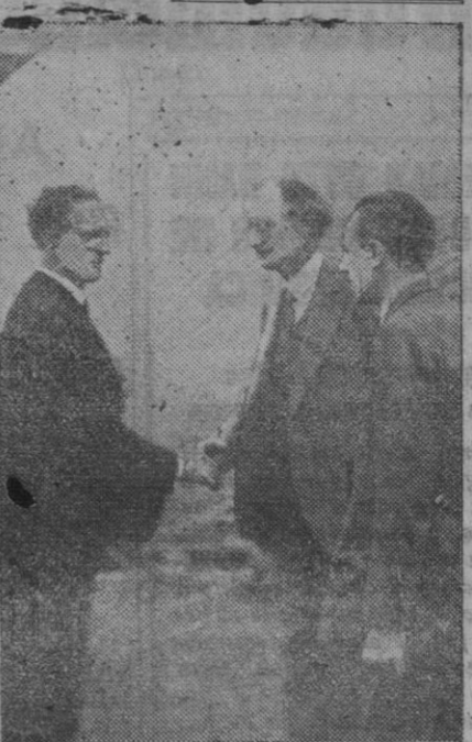
En la fotografía, el Rey de Bélgica (a la izquierda) saludando al doctor Piccard durante una visita que hizo poco antes de la guerra al ilustre profesor