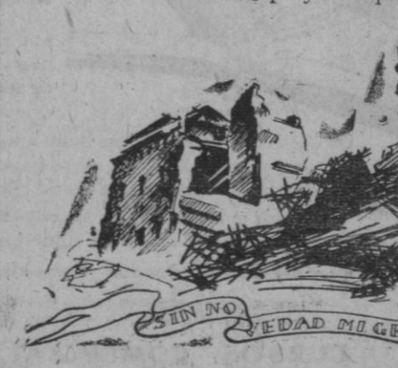
Se instalarán dormitorios, gimnasios, clases prácticas de táctica y balística, salas de tiro y maquetas de campos de operaciones.