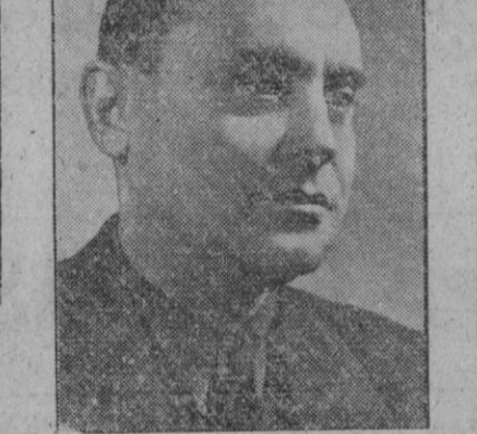
El nuevo presidente del Consejo de ministros húngaro, Franz Szalasi, jefe del Movimiento nacional húngaro

soldados se hallan en Buding, Metzervisse y Reinange. Otras unidades han penetrado en Norroy, Le Veneur, Lorry, Marly y Frontigny, en el sector de Metz. Caza-bombarderos apoyaron a las fuerzas de tierra mediante ataques a ciudades fortificadas y defensas terrestres, así como contra objetivos rúteres y ferroviarios situados detrás de las líneas enemigas. Fueron atacados asimismo emplazamientos artilleros, concentraciones de tropas y depósitos de munición, y destruidos vagones, locomotoras y transportes por carretera. Los vuelos de los cazabombarderos se extendieron desde Duren, Julich y Aquisgrán, en el Norte, hasta Comar y Mulhouse, en el Sur, pasando por el valle del Saar y Metz. Bombarderos medios atacaron un depósito de munición en Hagenu, fueron derribados cinco aviones enemigos durante las operaciones del día, mientras que otros quince fueron destruidos en tierra cerca de Frankfurt. No han regresado cinco aviones aliados.