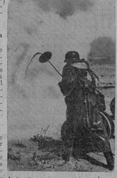
Al penetrar aviones enemigos sobre zonas costeras alemanas, los principales puertos son cubiertos con niebla artificial

Referencia alemana Berlín, 18 (5 t.).—Del comunicado de hoy: Londres y la región de Amberes han sufrido el fuego de nuestras armas a distancia. Los aviones de terror angloamericanos han atacado Viena, Salz-