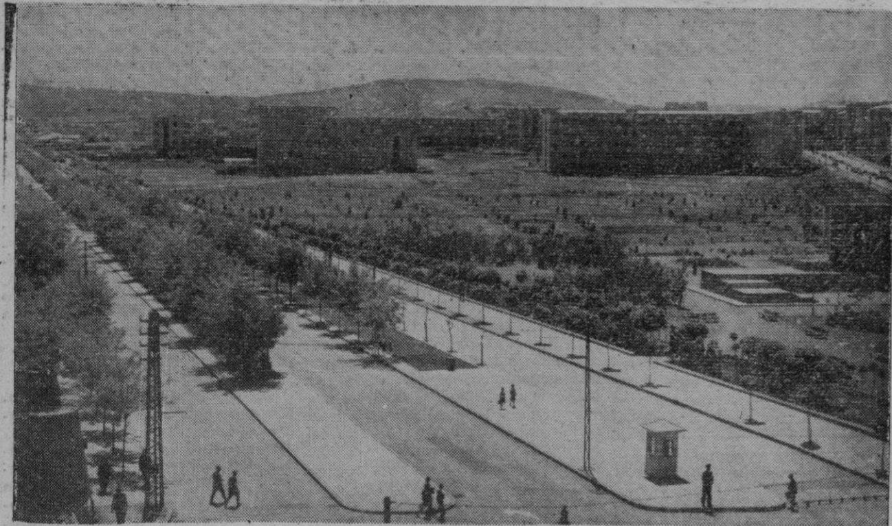
El barrio de los ministerios, de Angora, en el que actualmente están fijadas las miradas del mundo como consecuencia de la ruptura de Turquía con Alemania

Medidas del Gobierno turco como si el país estuviese en vísperas de entrar en guerra