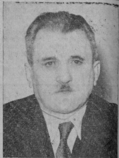
Darnand, jefe de la Milicia francesa