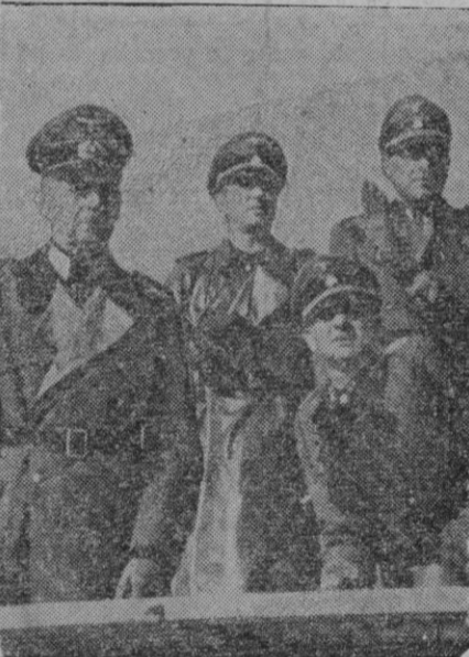
Durante unas maniobras en la costa atlántica, von Rundstedt escucha las explicaciones que le da el general de las S. S., Jepp Dietrich, sobre un ataque de unidades motorizadas