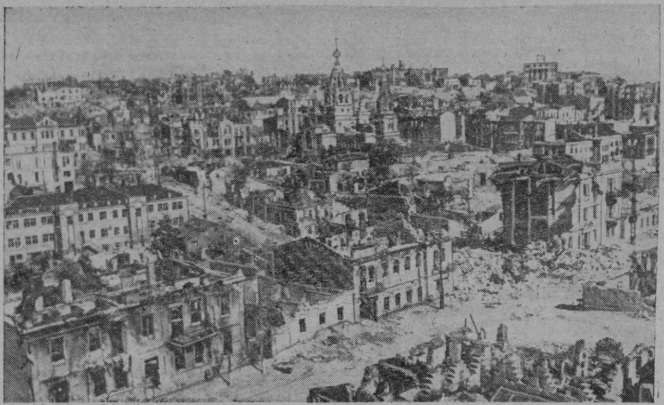
Una vista de la ciudad de Sebastopol, arrasada durante los combates que precedieron a su conquista por los alemanes, y actualmente último escenario de la guerra en Crimea. Como es sabido, la primera tentativa soviética para apoderarse de la gran fortaleza del mar Negro, ha fracasado