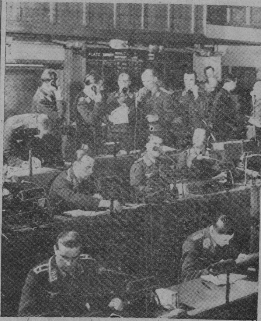
Fotografía de una estación alemana de una división aérea de información, en plena actividad, recibiendo y transmitiendo órdenes y observación, durante una incursión aérea aliada sobre el continente

tra los objetivos industriales y militares de Berlín ha sido realizado un poco antes del mediodía por grandes formaciones de fortalezas volantes y «Liberators», con una fortísima escolta de cazas de los Ejércitos aé-