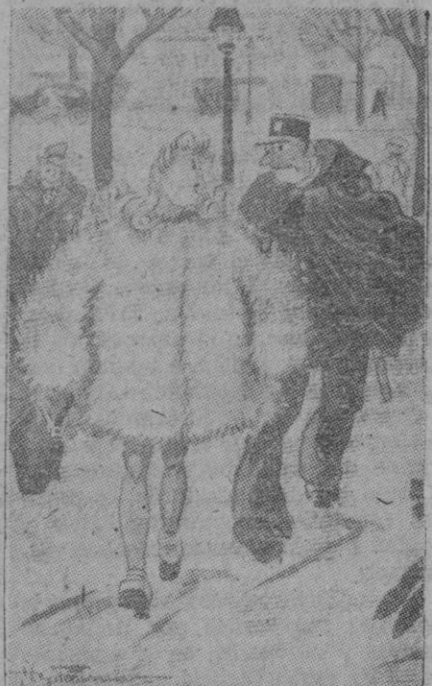
—Pero mi querido guardia... Yo le aseguro a usted que por dentro yo voy completamente vestida...