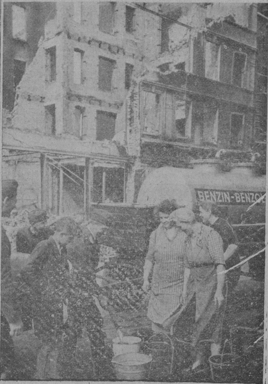
Distribución de agua potable por los servicios auxiliares del Ejército alemán entre los damnificados de uno de los distritos de Berlín más castigados por los bombardeos aéreos