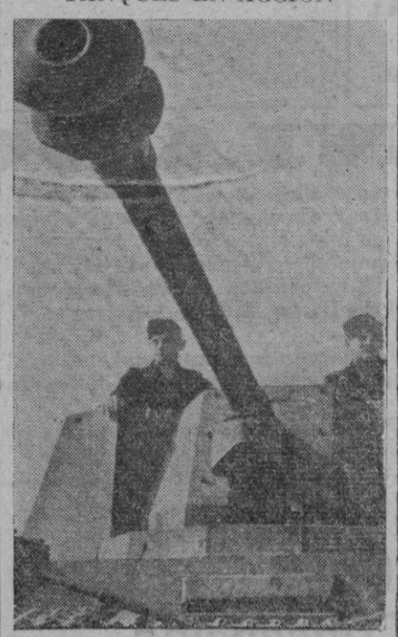
Un tanque alemán "Tigre" con su famoso cañón, dispuesto para entrar en acción