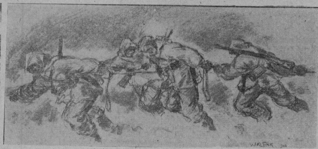
De nuevo ha nevado copiosamente en algunos sectores del frente del Este. El frío y la nieve dificultan las operaciones. El lápiz de un corresponsal de guerra alemán ha recogido con gran exactitud los esfuerzos sobrehumanos que unos soldados tienen que hacer para cambiar una pieza artillera de posición