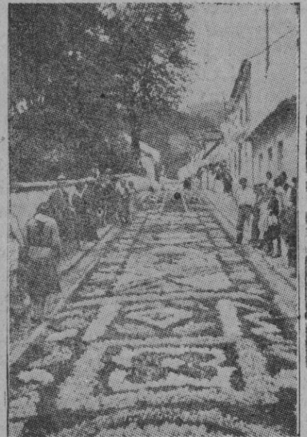
El archipiélago portugués de Las Azores, sobre el que recientemente se ha fijado la mirada del mundo, es famoso por su riqueza en flores. En las grandes solemnidades, la población alfombró las calles con flores de los más bellos colores y especies constituyendo una maravillosa ornamentación, como puede apreciarse en esta foto

Ataques contra el Norte de Francia. Londres, 19 (2 t.).—El ministerio del Aire comunica: Bombardeos Typhoon atacaron ayer, tarde diversos objetivos en el Norte de Francia. Escuadrillas de Spitfires apoyaron estas operaciones, y al mismo tiempo realizaron diversos ataques contra la circulación ferroviaria. Un Spitfire no ha regresado a su base.—Efe.