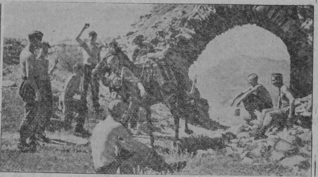
En Albania los mulos son empleados por los soldados alemanes como medio de transporte en el accidentadísimo terreno

efectuar un movimiento más amplio en los Balcanes y; decididamente, se va haciendo tarde para iniciarle.