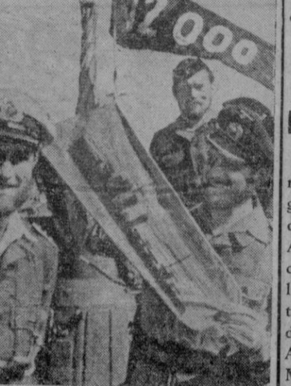
La tripulación de un destructor alemán celebra el hundimiento de 12.000 toneladas enemigas