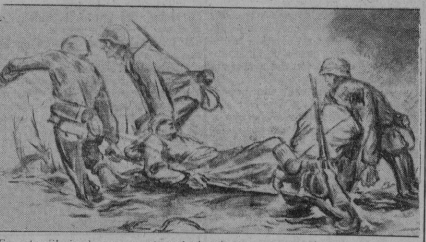
En este dibujo de un corresponsal alemán, se recoge el abnegado salvamento de un herido, sin preocuparse del peligro

Los ataques soviéticos fueron rechazados al Norte del Azof y en el Dniéper medio Contraataques alemanes realizados con éxito Comunicado alemán Cuartel General del Führer, 14 (5 t.)—El Alto Mando de las fuerzas armadas alemanas comunica: Al Norte del mar de Azof y en el curso medio del Dniéper, el enemigo repitió ayer, miércoles, sus intentos para romper nuestro frente. Fue rechazado en durísimos combates. Algunas brechas locales han sido tapadas.