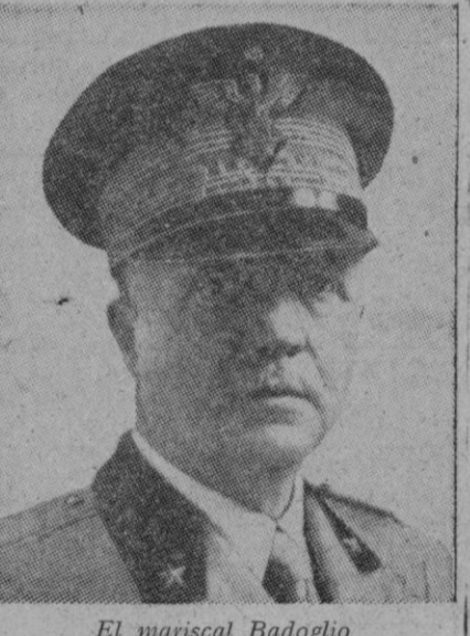
El mariscal Badoglio

Londres, 13 (n.).—En Londres, Washington y Moscú ha sido publicada simultáneamente la siguiente declaración conjunta: "Los Gobiernos de Gran Bretaña, Estados Unidos y U. R. S. S. reconocen la posición del Real Gobierno italiano en la forma anunciada por el mariscal Badoglio y aceptan la cooperación activa de la nación y de las fuerzas armadas italianas en concepto de cobeligerantes en la guerra contra Alemania. Los sucesos militares ocurridos desde el día 8 de Septiembre y el trato infligido por los alemanes a la población italiana han transformado a Italia en cobeligerante de hecho y los Gobiernos norteamericanos, británico y soviético seguirán obrando sobre tal base con respecto al Gobierno italiano. Los tres Gobiernos reconocen el compromiso contraído por el Gobierno italiano de someterse a la voluntad del pueblo italiano una vez hayan salido de Italia los alemanes, quedando bien sentado que por nada podrá vulnerarse el derecho absoluto y libre de toda coacción del pueblo de Italia para decidir por medios constitucionales la forma democrática de su gobierno."—Efe.