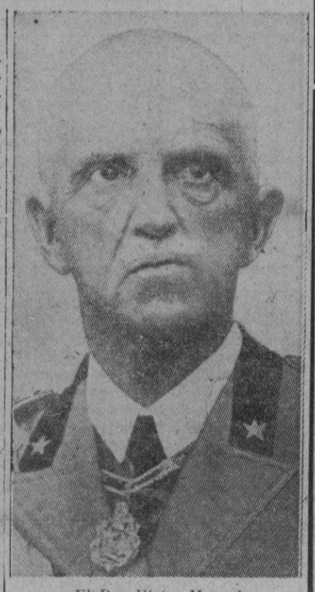
El Rey Victor Manuel