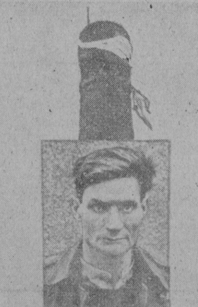
Un piloto inglés que, abandonando su aparato inflamado, por medio de paracaídas, sobre una ciudad alemana, quedó enganchado en una chimenea de treinta metros, ha sido una de las más pintorescas notas de la actualidad guerrera. Un retrato del piloto después del descenso a hombros de un voluntario trepador y la chimenea con los restos del paracaídas, aún enganchados en lo alto