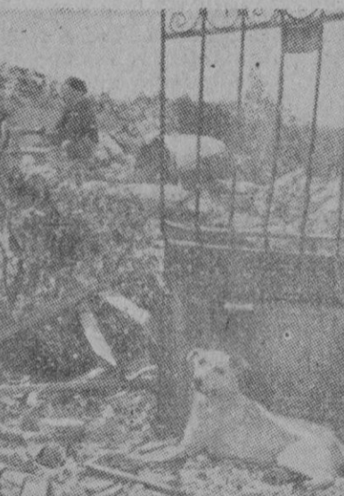
La fidelidad de un perro puede llegar a extremos insospechados. Después de un bombardeo sobre una ciudad francesa, este noble animal se echó a la puerta de la casa demolida para esperar al amo que no regresará jamás.