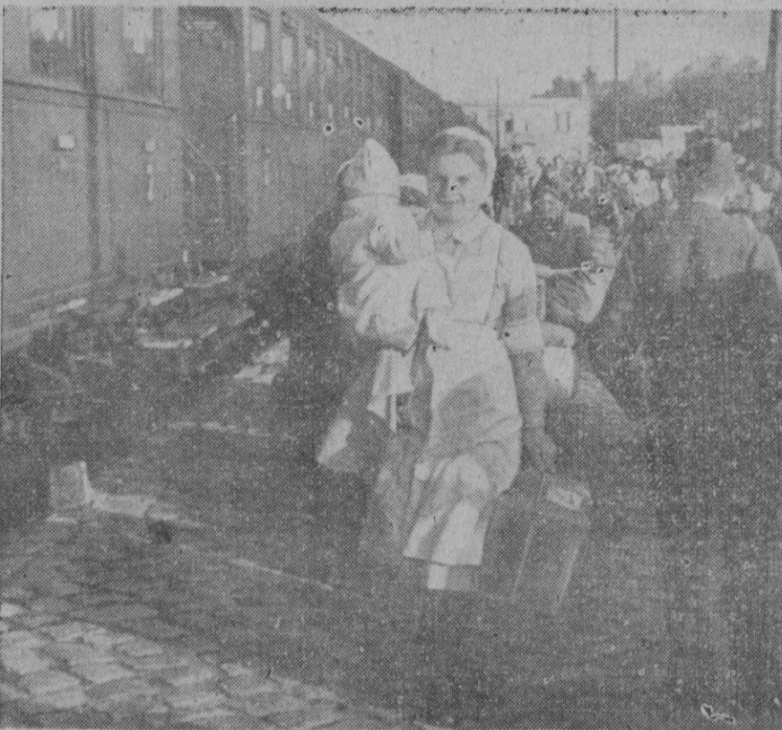
Los niños y las mujeres lactantes o en cinta son evacuadas de Berlín hacia lugares menos amenazados de bombardeos. Enfermeras de servicio ayudan a las mujeres y a los niños viajeros a instalarse en el tren, facilitándoles todo lo necesario para el viaje