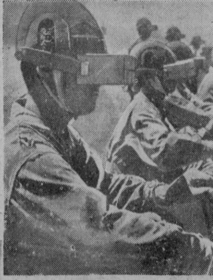
Los conductores de carros de asalto japoneses, se acostumbran a la vista limitada que tendrán dentro del tanque, por medio de una pieza de madera a modo de pantalla...