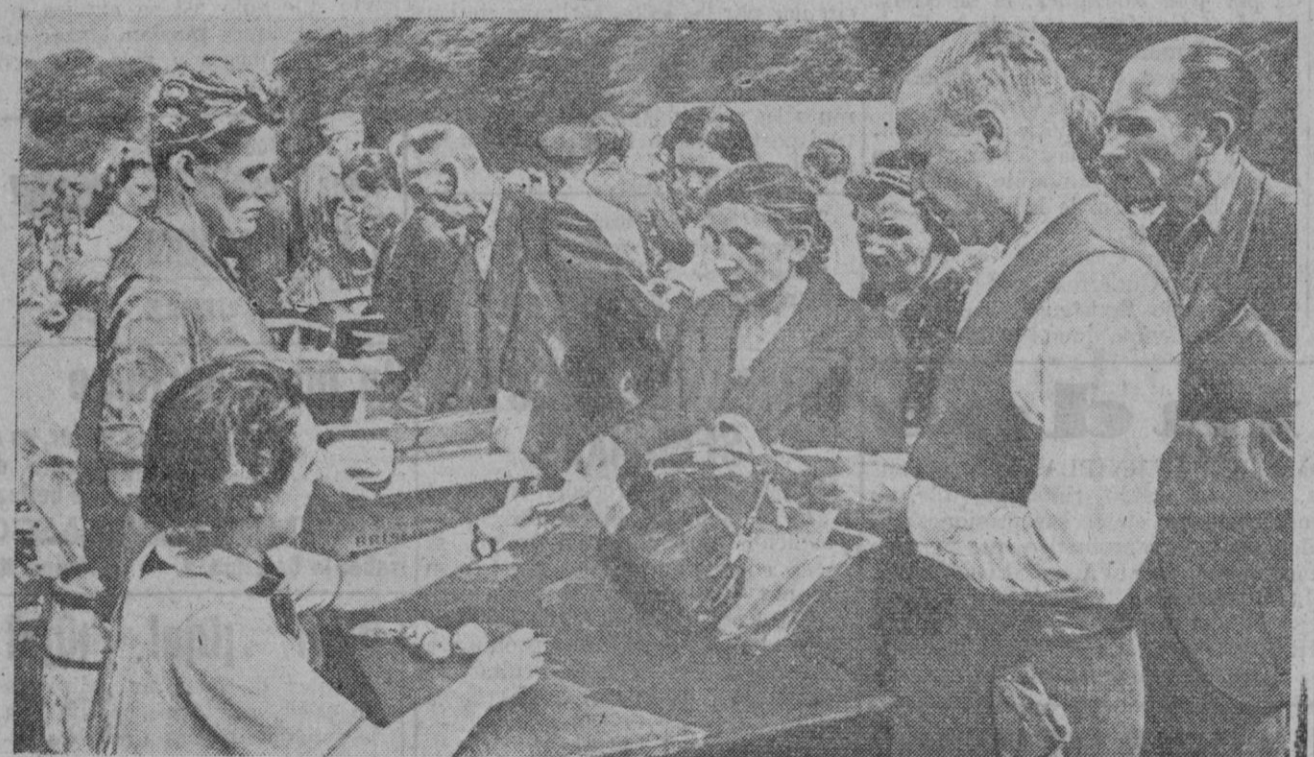
Los habitantes de una ciudad italiana que han quedado sin albergue a consecuencia de los violentos bombardeos aliados reciben del Estado diariamente, raciones suplementarias para su alimentación