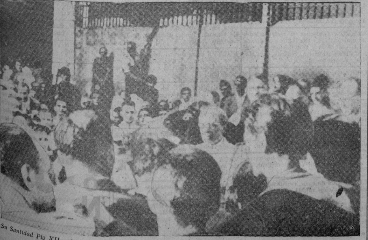
Su Santidad Pio XII rodeado de la multitud en el barrio Tiberino, de Roma, momentos después del último bombardeo aliado sobre la ciudad