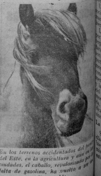
En los terrenos accidentados del Este, en la agricultura y en las ciudades, el caballo, revalorizado por la falta de gasolina, ha vuelto a ser indispensable