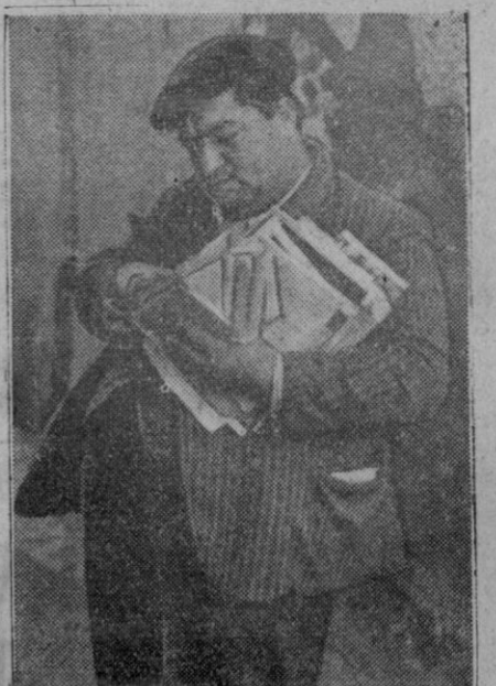
Este pacífico cartero de la isla repartió cachazudo su correspondencia, antes, naturalmente, de que los bombardeos y la guerra turbasen la vida de la hermosa isla