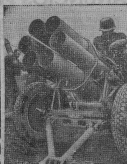
Primera foto del cañón lanzanigbla, nueva arma alemana, eficazmente empleada en el frente del Este. Cuando los obuses de niebla son lanzados por las seis bocas a la vez, se produce una tremenda explosión de gran poder destructivo