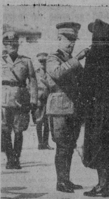
El Rey de Italia colocando una condecoración sobre el pecho de una viuda de guerra