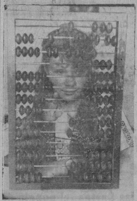
Este grabado no es de un colegio, sino de una oficina rusa, en las que los contables y cajeros emplean el contómetro corrientemente, sirviéndose de él con extrema habilidad.