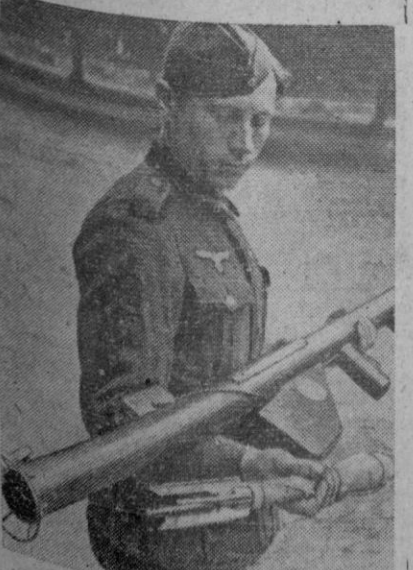
He aquí el "Stanley", arma antitanques norteamericana, que en la foto es mostrada por un soldado alemán.