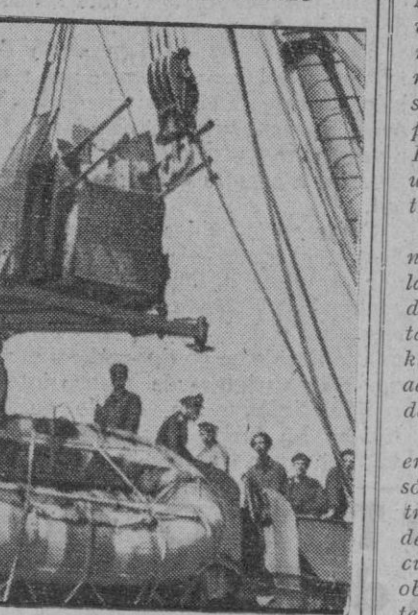
Momento de ser montada a bordo de un destructor italiano una batería anti-aérea