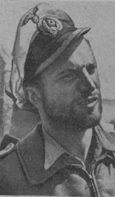
En el rostro de este comandante de un submarino alemán, que ha regresado a su base después de haber causado grandes pérdidas a la flota enemiga, refléjase el cansancio de los últimos días en que se desarrollaron duras batallas navales