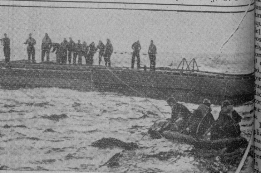
Un marino alemán que ha enfermado y necesita estar bajo control, es transportado por medio de un bote neumático a otro navio que se dirige a la Patria

«¿Se ha pensado lo que significaría el sólo anuncio de la presencia del bolchevismo en las campañas de Europa? ¿Podría algo garantizar a los ejércitos que allí se congregasen contra el inmediato contagio? Aun aceptado esto, ¿estaría Europa en condiciones de sostener una guerra ideológica contra el avance devastador del comunismo? A la conciencia pública abandono la respuesta» (Palabras de Franco en el Pleno del Consejo nacional de F. E. T. y de las J. O. N.-S.)