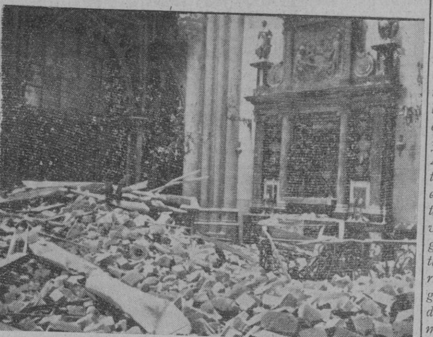
Aspecto que ofrece el interior de un ala de la Catedral de Colonia, que recientemente ha sufrido graves destrozos como consecuencia de un bombardeo de la aviación aliada

Su Santidad inspecciona los daños causados en la basílica de San Lorenzo