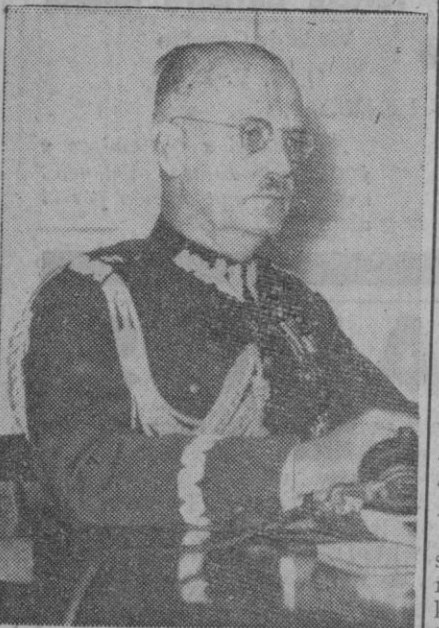
El general Sikorski, jefe del Gobierno polaco en Londres, que murió recientemente a consecuencia de un accidente aéreo ocurrido en las cercanías de Gibraltar

Prima de 0,30 para las cantidades que rebasen dichos cupos