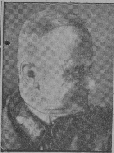
El general alemán Haase, conocido escritor de temas militares y que últimamente se ha ocupado de la proyectada invasión de Europa por los aliados. Dicho general, que no excluía la posibilidad de que pudiera efectuarse algún desembarco, diferenciaba esta operación de las llamadas propiamente de conquista, y en este punto "se permitía" gastar algunas chanzas al enemigo

Roma, 13 (2 t).—Durante las últimas veinticuatro horas—dice la Agencia Stefani—la aviación italiana ha alcanzado con bombas y torpedos a 52 buques aliados en aguas de Sicilia. Una formación de aviones torpederos ha hundido cinco vapores y averiado otros tres. Otra formación ha provocado un incendio, visible a 50 kilómetros de distancia, a bordo de un mercante. Aviones torpederos alcanzaron un crucero, escoltado por unidades de pequeño tonelaje, cuando navegaba a seis millas de las costas. También fué alcanzado un crucero ligero. Otro crucero de 6.000 toneladas fué averiado, a pesar de la intervención de escuadrillas de caza que le escoltaban. Un gran buque, que formaba parte de un convoy integrado por cuatro transportes, fué hundido. Bombarderos en picado han causado averías en varios transportes.