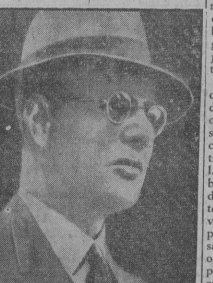
El primer ministro australiano, Curtius, que ha disuelto el Parlamento. Las nuevas elecciones se celebrarán en Agosto próximo