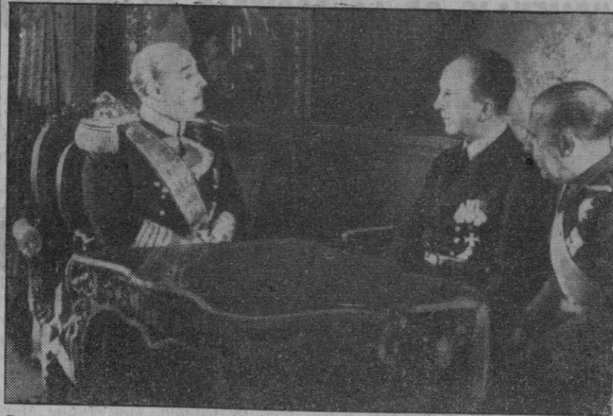
Después del solemne acto de la entrega de credenciales al Caudillo, por el nuevo embajador de Alemania en España, Su Excelencia tuvo un breve coloquio con el citado diplomático, en presencia del ministro de Asuntos Exteriores