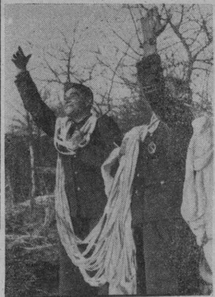
Granaderos alemanes han recibido por medio de un avión de transporte gasolina y víveres en su posición de combate más avanzada.