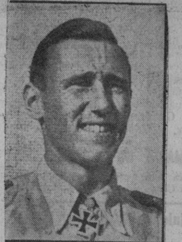
La escuadrilla de caza alemana 52, ha logrado su 5.000 victoria aérea como caso único, hasta ahora, de la guerra aérea. En estas fotografías aparecen los jefes de la escuadrilla citada