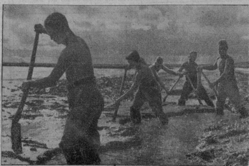
Una región ha sido inundada y es necesario realizar drenajes para que el agua corra y quede el suelo en estado transitado