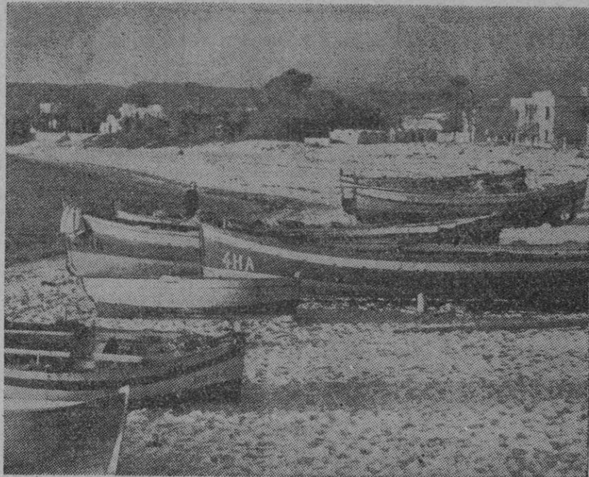
La villa placentera y romántica de Hammamet, en Túnez, lugar de refugio de turistas cosmopolitas en invierno, y que estuvo convertida en centro de los combates alrededor de la península del cabo Bon