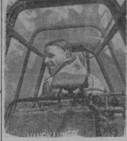
El conductor de un avión mira al convoy alemán que navega por el mar y al cual no se atreve a atacar ningún submarino enemigo mientras los aviones alemanes vuelan por encima de ellos.