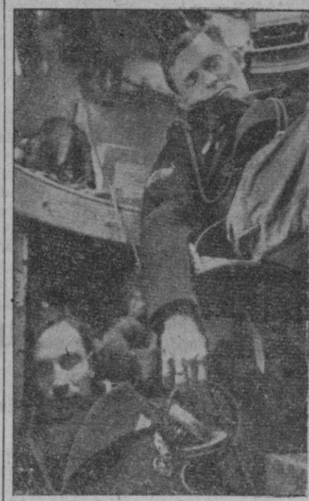
Interior de un gran tanque alemán que se utiliza en Rusia. El comandante luce en la manga las condecoraciones de destacada actuación.

Mañana se reúne presidido por Sanz Orrio Mañana jueves, a las cinco de la tarde, se reunirá el Consejo Nacional de Ordenación Económica, bajo la presidencia del vicesecretario de Obras Sociales y delegado nacional de Sindicatos, camarada Fermín Sanz Orrio. Asistirán a la reunión todos los jefes y secretarios de los Sindicatos nacionales, el vicesecretario nacional de Ordenación Económica y otras jerarquías nacionales. En esta reunión informará el jefe del Sindicato nacional de la Vid sobre los diferentes problemas de la Organización y otros asuntos de actualidad.