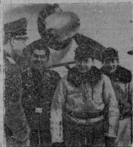
El capitán Philip, condecorado con las Hojas de Roble con Espadas, conversando con sus camaradas después de un vuelo victorioso