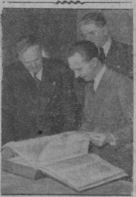
El Führer ha condecorado con el Escudo del Águila Alemana, al profesor alemán Wilhelm Kreis, que aparece en la foto, al lado del ministro del Reich, doctor Goebbels. El profesor Kreis es uno de los más insignes arquitectos alemanes de la actualidad.

Méjico, 8 (2 t.).—El Presidente de la República, Avila Camacho, saldrá de Méjico con destino desconocido, para celebrar conversaciones con los Gobiernos aliados. El Presidente ha pedido al Congreso autorización para ausentarse del país por setenta y una horas.—Efe.