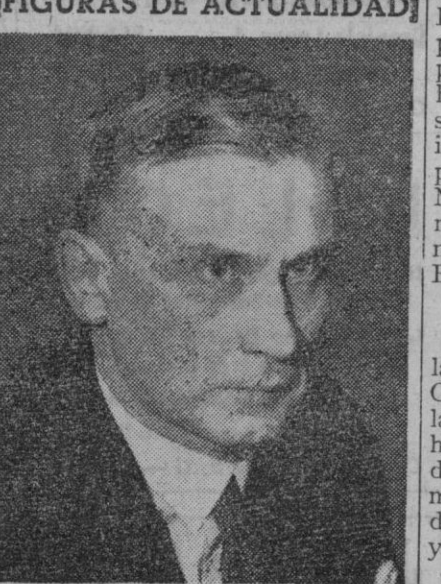
El profesor Edwin Linkomies, nuevo ministro de Estado de Finlandia