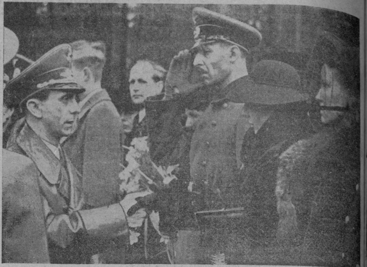
A la salida de los funerales celebrados en Berlín por las almas de las víctimas de los bombardeos ingleses contra la capital alemana, el ministro de Propaganda del Reich, doctor Goebbels, testimonia su pésame y dedica palabras de consuelo a los deudos de aquéllas