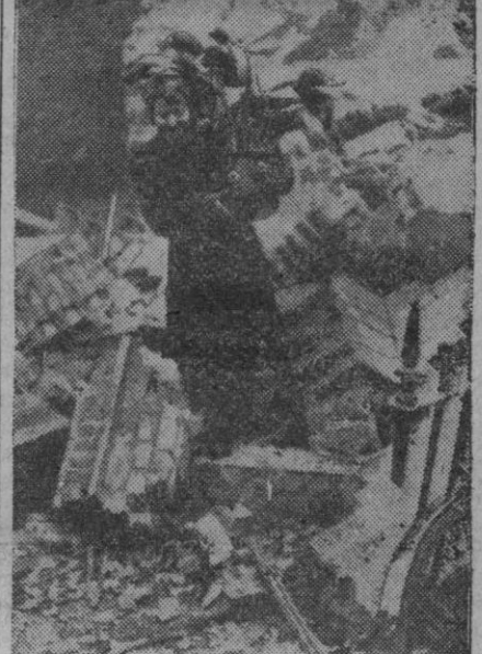
Esto es lo que queda de una casa después de un bombardeo de la aviación. Una mujer recupera algunos objetos de su hogar deshecho

Comunicado aliado Argel, 23 (6 t.).—Comunicado del Cuartel General aliado de África del Norte. Frente del octavo Ejército: Las operaciones prosiguen satisfactoriamente, según los planes previstos. Continúa encarnizadamente la batalla al Sureste de la línea Mareth. El número de prisioneros asciende a 1.700, según los datos recibidos hasta hoy.