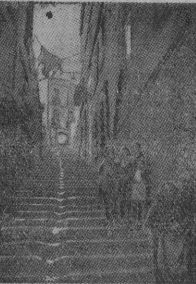
Fotografía de una de las numerosas calles estrechas y sombrías del barrio antiguo del puerto de Marsella, que van a desaparecer para dejar espacio a las construcciones modernas