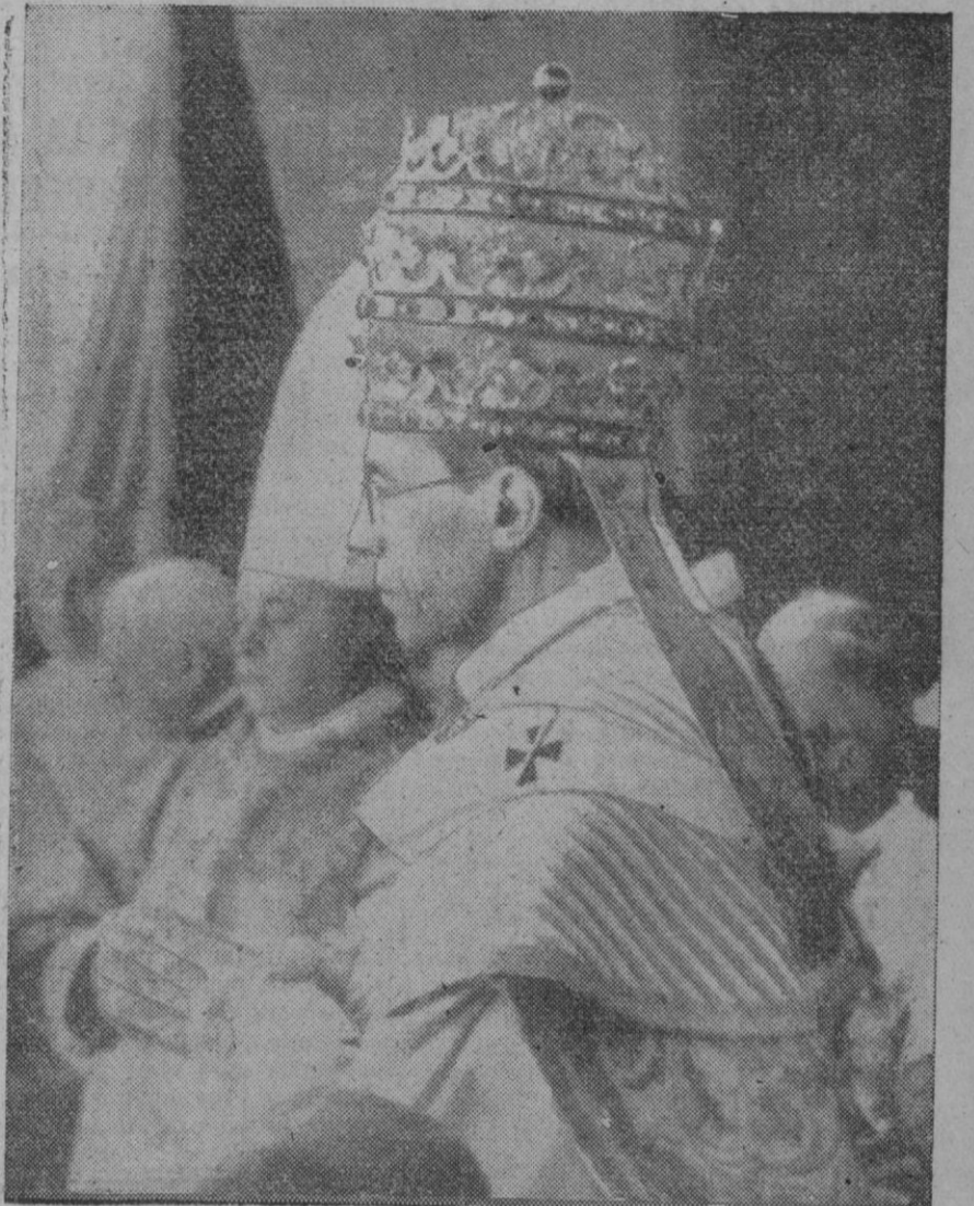
Su Santidad Pio XII, a quien el mundo católico rindió ayer homenaje de adhesión y, España, de un modo singular y fervoroso, cual corresponde a un pueblo de tan honda tradición cristiana como el nuestro.

Se registran concentraciones, cada vez mayores, de barcos nipones frente a Australia del Noroeste, concentraciones integradas por buques de transporte de tropas y material.—Efe.