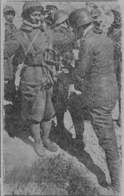
Un soldado alemán registra a varios prisioneros franceses y americanos, capturados en el frente tunecino