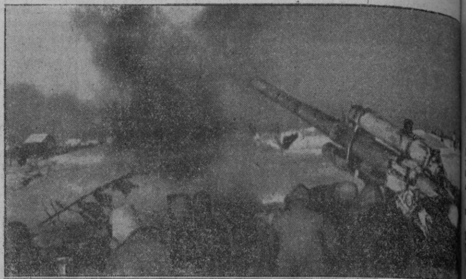
Artillería pesada alemana haciendo fuego contra una concentración de fuerzas soviéticas

La batalla de invierno en el Este continúa con violencia no disminuida. Sin embargo, las tropas alemanas dominan la situación en el conjunto del frente.