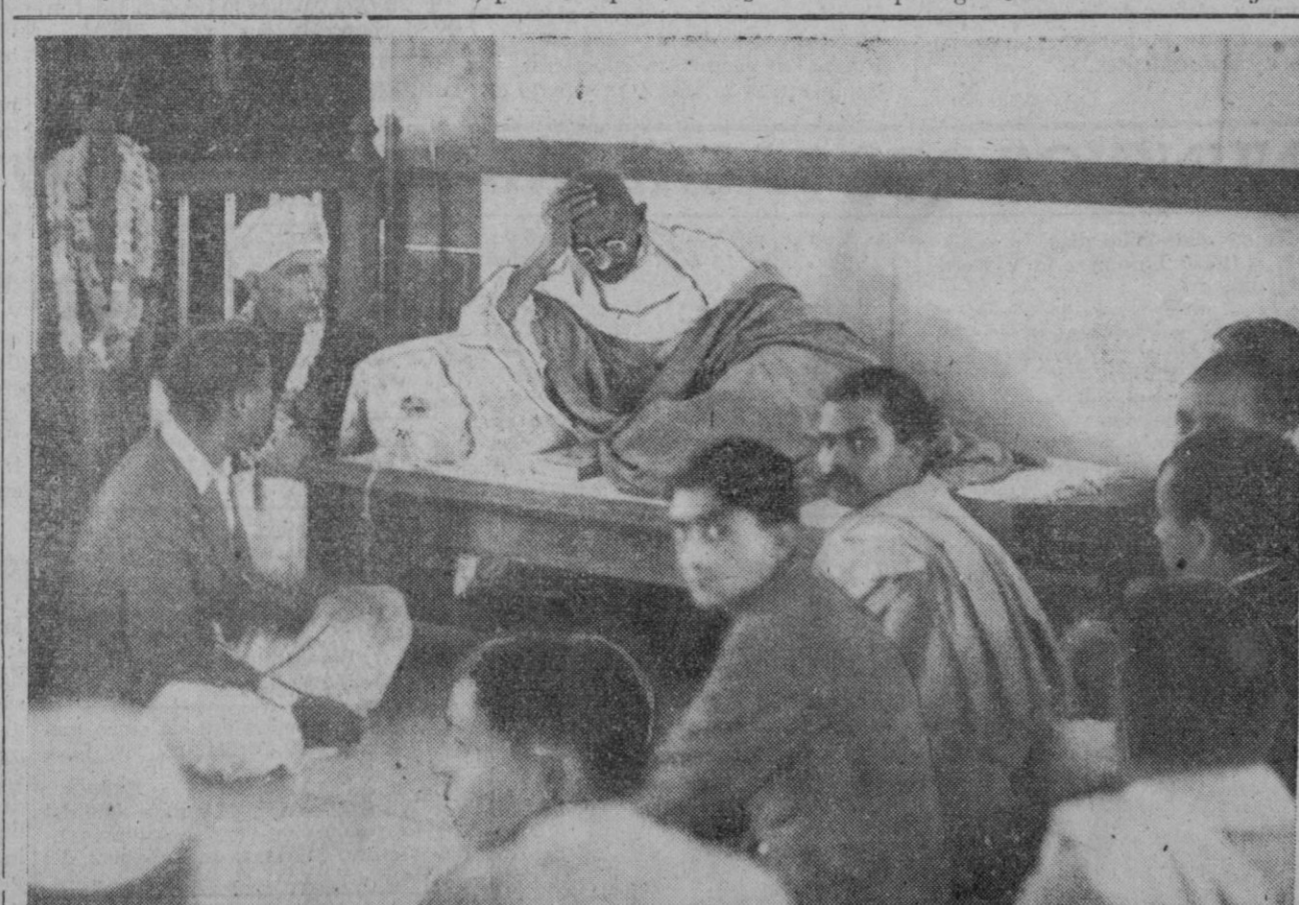
El mahatma Gandhi ha llegado al término de su ayuno, que ha soportado de una manera sorprendente, ya que en los primeros días de aquél los médicos que le asistían consideraron punto manos que imposible que el jefe indio no pagara con su vida esta nueva y prolongada privación voluntaria de toda clase de alimentación. En la fotografía vemos al jefe indio durante una reunión política con varios de sus partidarios.

Berna, 9 (2 t.).—Oficialmente se anuncia que en la noche del 8 al 9 de Marzo, entre las 23,27 y las 23,38 horas, una pequeña formación de aviones extranjeros ha volado sobre territorio de Basilea. Fué dada la señal de alarma en algunas regiones del Noroeste de Suiza.—Efe.