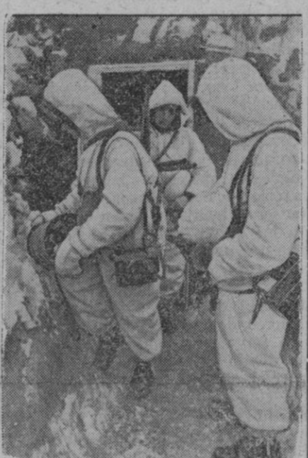
Una patrulla de transmisores alemanes sale de su refugio para cumplir la orden recibida, con lo cual se restablecerá la comunicación cortada

En la parte septentrional del frente central, las tropas alemanas han continuado reforzando sus líneas mediante un acortamiento metódico de los frentes. Los movimientos se llevan a cabo sin entorpecimiento por la acción de los soviets. En muchos casos se pone evidentemente de manifiesto la incapacidad de los bolcheviques, de seguir a las fuerzas alemanas que por orden del mando se retiran de una localidad. Así se ex-