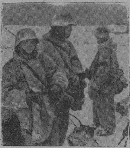
Un grupo de ganaderos blindados de las S. S. esperando órdenes sobre el próximo objetivo a cumplir contra las posiciones de defensa soviéticas

En la serie de movimientos de despegue que desde el recodo del Don se dirigen hacia la línea defensiva más corta que ha sido prevista, fueron evacuadas las ciudades de Rostof y Voroschilofgrado, de acuerdo con