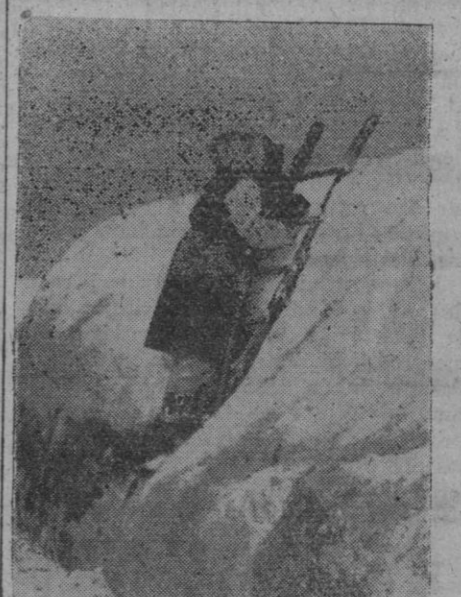
Puesto de observación alemán en una trinchera del frente oriental.

Helsinki, 14.—Sobre diversas regiones finlandesas han sido vistos globos incendiarios, que miden cinco metros de diámetro y están dotados de un largo cable de anclaje. Varios de dichos globos, que resultaron ser británicos, han sido derribados por las escopetas de los campesinos.—Efe.