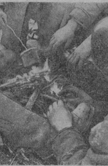
Durante una tregua en la lucha, este grupo de soldados, reunidos en torno a la lumbre, dan buena cuenta del rancho en frío