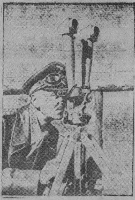
El general alemán Paulus, comandante en jefe de las tropas que sucumbieron heroicamente con él en Stalingrado

Una vez hecha esta aclaración, voy a pasar a explicaros un poco lo que es la Sección Femenina y después os daré unas normas que creo indispensables para elevar el nivel de cultura de España. Con esta vida tan ajetreada que llevamos en la Falange casi no hemos tenido tiempo de preparar lo que voy a deciros, además recién terminado nuestro Consejo de Santiago todavía estamos en los horrores del aplacamiento de toda la tarea que desde allí hemos traído. Por lo tanto, tendréis que perdonar la falta de respeto que supone el encararse con un auditorio, casi sin haber pensado lo que se va a decir.