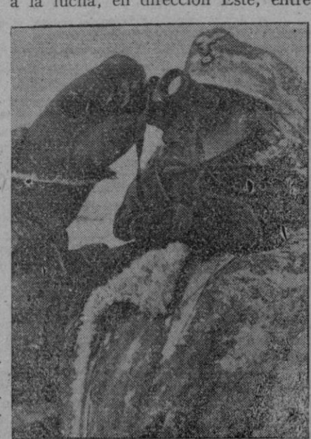
Los hombres de las baterías antiaéreas alemanas, bien equipados contra el frío, observan atentamente todo el cielo, en busca de aviones enemigos

En la región del Kubán y en la estepa Sur de Manich, han sido rechazados los ataques de las fuerzas blindadas soviéticas. En el curso de contraataques, las formaciones acorazadas alemanas han dispersado a una división de Caballería de la guardia soviética y a una formación de Infantería. Reservas traídas de la retaguardia por los soviets han sido lanzadas a la lucha, en dirección Este, entre