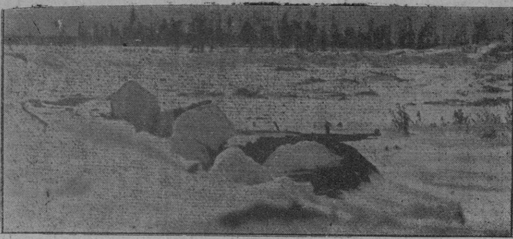
Soldados alemanes en un puesto avanzado del frente del Este

Berlín, 29 (2 t.).—Cincuenta y un industrias han sido declaradas empresas modelos en tiempo de guerra en la sesión de la Cámara de Trabajo del Reich celebrada en la sala de los Mosáicos de la Cancillería. El doctor Hauey, delegado del doctor Ley, pronunció con esta ocasión unas palabras en las que dió la consigna del pueblo alemán, que lucha por su suerte futura. Todo el trabajo para la victoria. Es necesario—añadió—que sea así sin perjuicio de que sean reconocidos los esfuerzos de los obreros alemanes. Queremos vencer—siguió diciendo—hemos de movilizar todas las fuerzas de la nación. El heroísmo del frente debe encontrar eco en el trabajo de la retaguardia. La victoria será el resultado de esfuerzo supremo encima del trabajo medio habitual. Las necesidades de la hora exigen de cada uno todo el rendimiento de que sea capaz.—Efe.