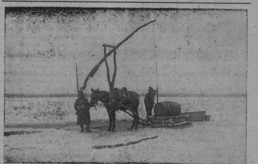
El agua potable es un factor de capital importancia en el frente africano. En la fotografía vemos a dos soldados del Eje abasteciéndose de agua en un pozo por el primitivo procedimiento del cigüeñal y el cubo

Se reciben noticias del mar Negro de que los vapores que habían aparejado de diferentes puertos, se han visto obligados a buscar refugio. Solamente en el puerto de Eregh hay quince vapores que no han podido continuar sus rutas. El barco «Sueman», con un desplazamiento de 350 toneladas, se ha hundido en el estuario del río Sakarija. La tripulación ha sido salvada. Han llegado demasiado tarde los socorros enviados al vapor «Adana», que navegaba de Zunguldak a Estambul, con cargamento de carbón, y había lanzado el S. O. S. Los esfuerzos realizados por el navío auxiliar «Aldar» y el «Ege», así como por varios aviones para descubrir el paradero del «Adana», han resultado inútiles. Este barco desplazaba 1.675 toneladas y estaba dotado con dieciocho tripulantes y dos capitanes. La línea ferroviaria de Estambul a Edirne, que estaba bloqueada por la nieve, ha sido abierta de nuevo al tráfico. El tren de la noche, de Estambul a Sofía, ha podido reanudar el servicio.—Efe.