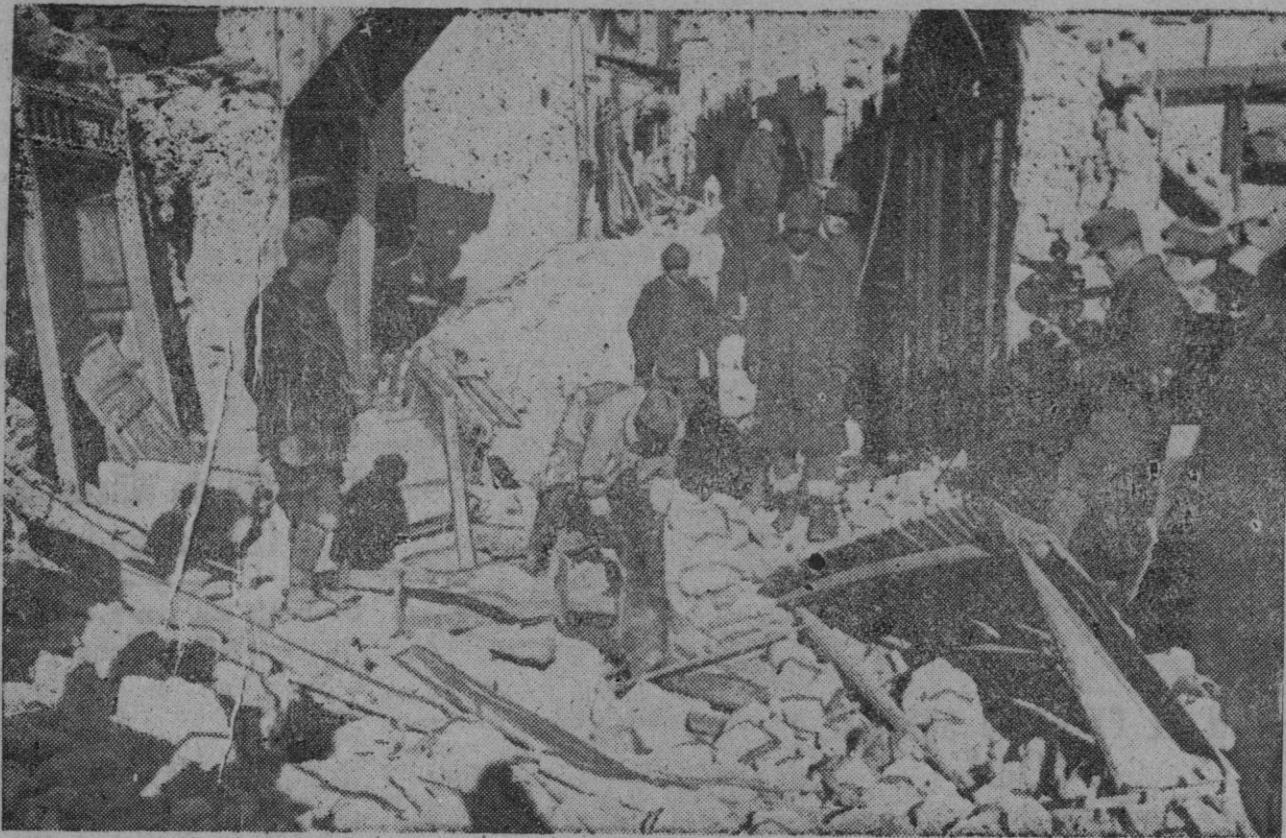
Ha bombardeado la aviación. El barrio árabe de Túnez ha sido alcanzado por las bombas y algunas casas han resultado destruidas. Obreros indígenas inician los trabajos de descombro

En la parte occidental de Tripolitania se mantiene la presión de las fuerzas aliadas