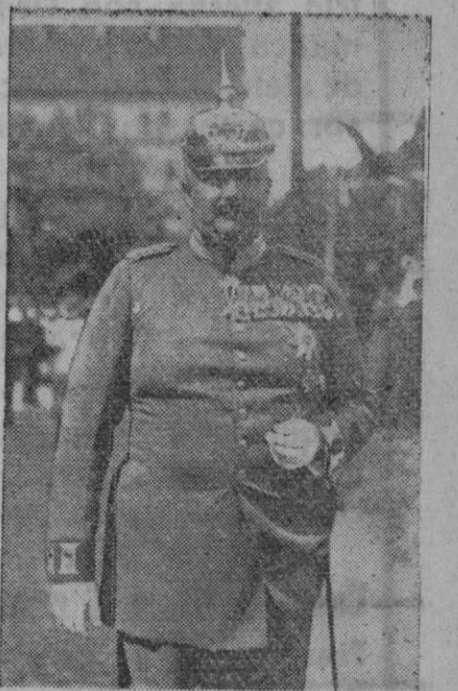
El Príncipe Eitel Friedrich de Prusia, segundo hijo del ex Emperador Guillermo, que ha muerto en Potsdam a la edad de cincuenta y siete años

Madrid, 7.—Ayer Su Excelencia el Jefe del Estado y Generalísimo de los Ejércitos ofreció en el Palacio de Oriente la tradicional comida de gala al Cuerpo diplomático acreditado en Madrid y al Gobierno. El Caudillo sentó a su derecha a la señora del ministro de Asuntos Exteriores, embajador de Portugal, señora del ministro del Ejército, embajador de la Gran Bretaña, señora del ministro de Educación Nacional, embajador de los Estados Unidos, señora del ministro de Colombia, ministro plenipotenciario de Suiza, señora del general jefe del Alto Estado Mayor, ministro de Agricultura, señora del ministro plenipotenciario de Croacia, ministro plenipotenciario de Venezuela, encargado de Negocios de Cuba, encargado de Negocios del Ecuador, encargado de Negocios de Italia, introductor de embajadores y el ayudante de campo teniente coronel señor Fontán.