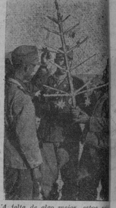
A falta de algo mejor, estos soldados alemanes del desierto africano se visan el árbol de Navidad